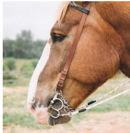
- TRACCIÓ ANIMAL - TREBALLEM 22,5 HECTÀREES DE VINYA AMB CAVALLS